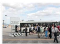
Una lunga battaglia giudiziaria per il servizio di trasporto dei passeggeri tra Sun Lines e Consorzio italiano autoservizi Scia di Sassari. In pratica, da quando l'Autorità portuale ha azzerato gli affidamenti precedenti e ha messo a bando tutte le concessioni, i gestori storici come la Sinergest oppure appunto la Sun Lines per quanto riguarda i trasporti sono progressivamente usciti di scena. Sun Lines però ha contestato sin dal principio l'affidamento del servizio alla Scia sostenendo con ampia documentazione che il parco mezzi della società aggiudicataria non fosse corrispondente all'offerta su cui l'Authority ha aggiudicato il servizio.

La diretta radio Estate e turismo in scacchiera la tavola rotonda