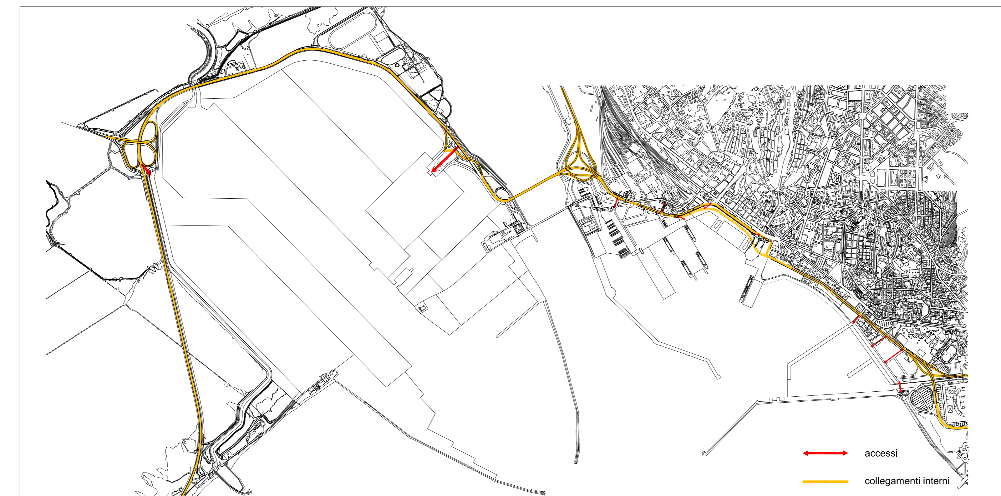
ACCESSI E COLLEGAMENTI INTERNI 1:20000