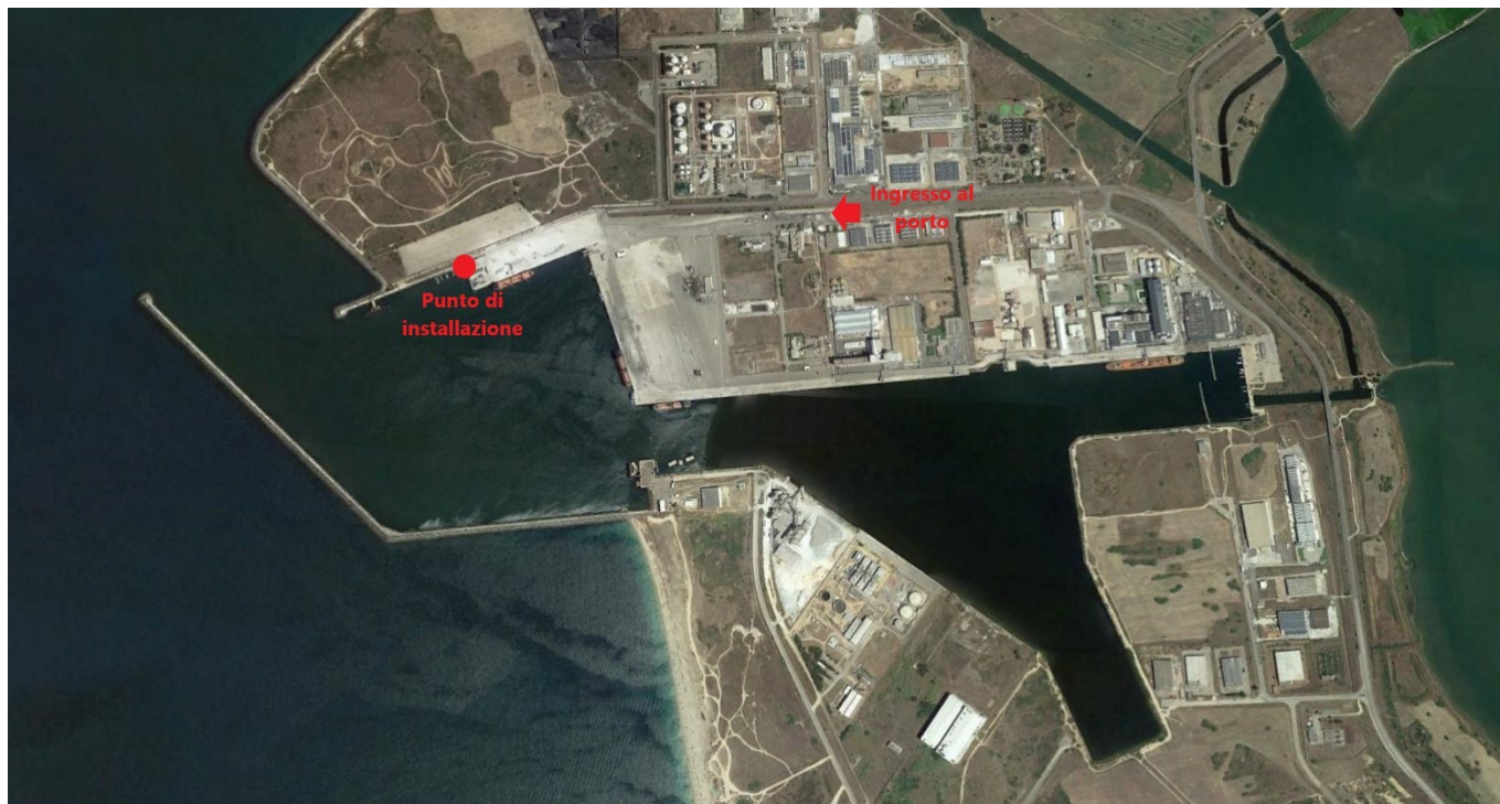
Figura 1 – Individuazione punto di installazione